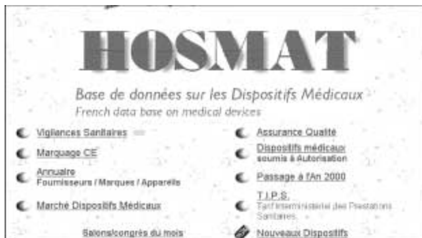
Figure 115 : Hosmat, la base de données sur les dispositifs médicaux.

Le TIPS sera bientôt disponible sur Hosmat, mais avec un accès payant.