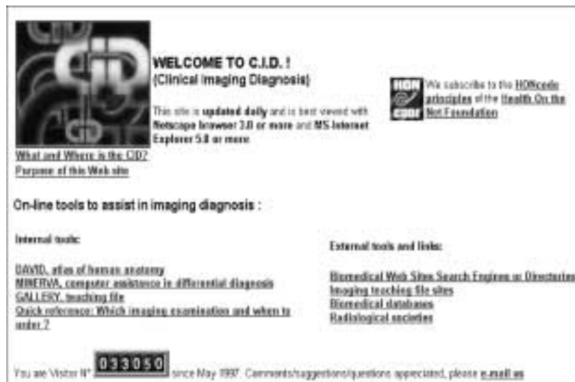
Figure 105 : Le Centre d'imagerie de Lausanne.