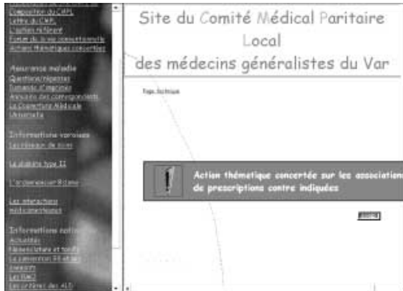
Figure 108 : Le site du CMPL des généralistes du Var.

Ce site est réalisé par l'interface conventionnelle entre les généralistes du Var et les services médicaux de l'Assurance maladie. On y trouve, notamment, les critères d'attribution de l'exonération du ticket modérateur, définis par le Haut comité médical de la Sécurité sociale ( http://perso.club-internet.fr/cmpl83/InfoN/ALD/aldsom.htm ).