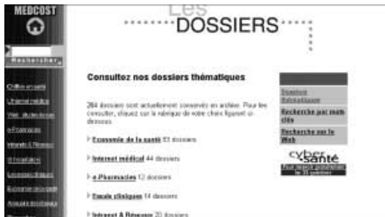
Figure 117 : Les dossiers de MedCost.

Ce site présente des analyses d'un grand intérêt. Il propose, notamment, des dossiers thématiques documentés sur des sujets d'actualité.