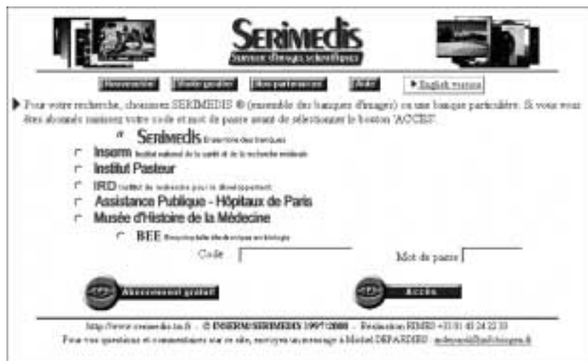
Figure 114 : Serimedis : un serveur d'images scientifiques.

Serveur d'images scientifiques (l'utilisation est possible après règlement de droits).