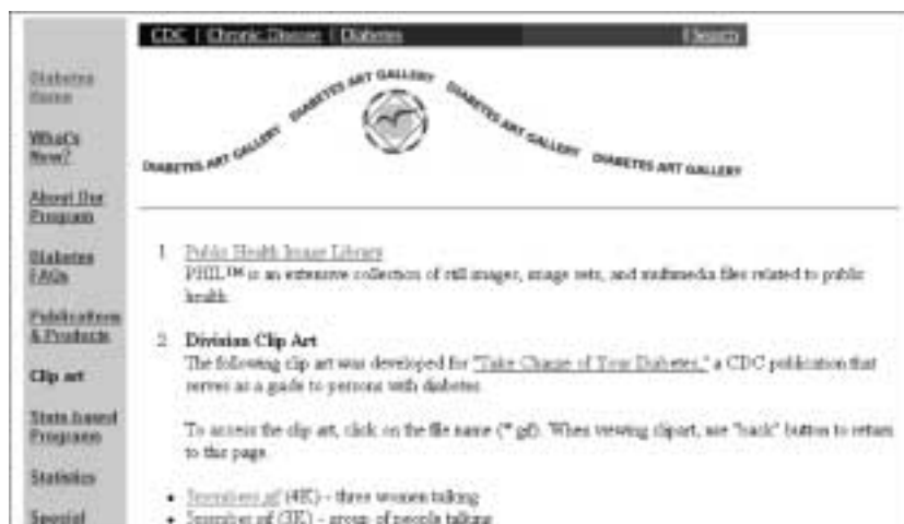
Figure 106 : Diabetes Art Gallery est une banque iconographique.

Il est cependant nécessaire d'informer les auteurs de l'utilisation de leurs images.