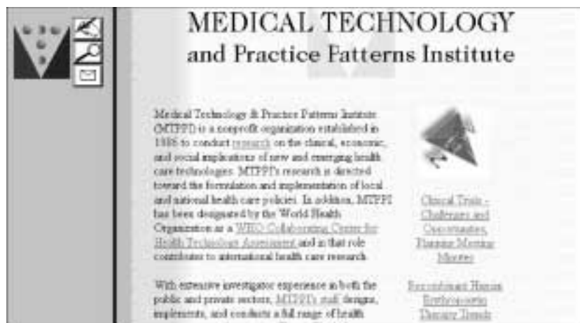
Figure 116 : L'accueil du Medical Technology and Practice Patterns Institute.

Site réalisé à Bethesda (Etats-Unis) sur les nouvelles technologies en relation avec la santé.