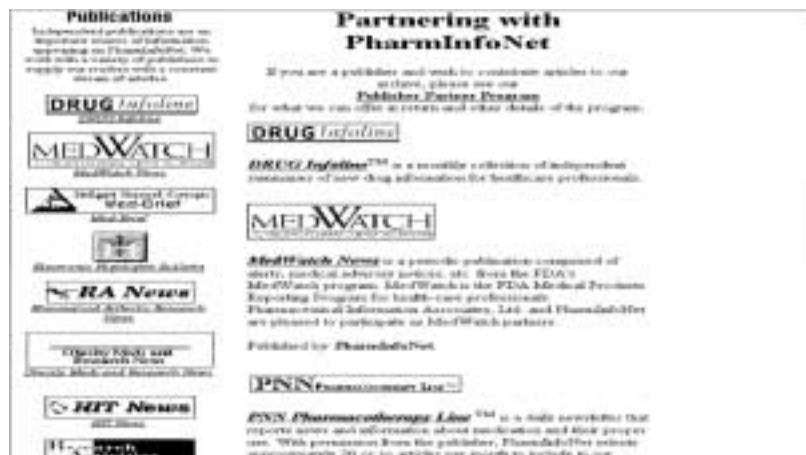
Figure 87 : L'accès aux bases de données proposées par PharmInfo Net.

Nous vous proposons de consulter, notamment, Drug Infoline et ses fiches par médicament. L'entrée vers les fiches se fait à l'aide d'un index alphabétique.