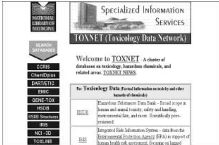
Figure 86 : La page d'accueil de Toxnet.

Site de la National Library of Medicine. Vous trouverez toutes informations en toxicologie.