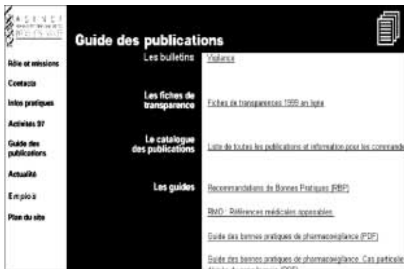
Figure 88 : Les rapports de l'Agence française de sécurité sanitaire des produits de santé.

Le guide des génériques, les rapports sur les médicaments veinotoniques, anti-dépresseurs et antibiotiques sont aussi disponibles sur ce site.