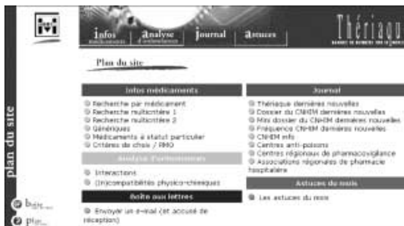
Figure 85 : Le plan du site de Thériaque.