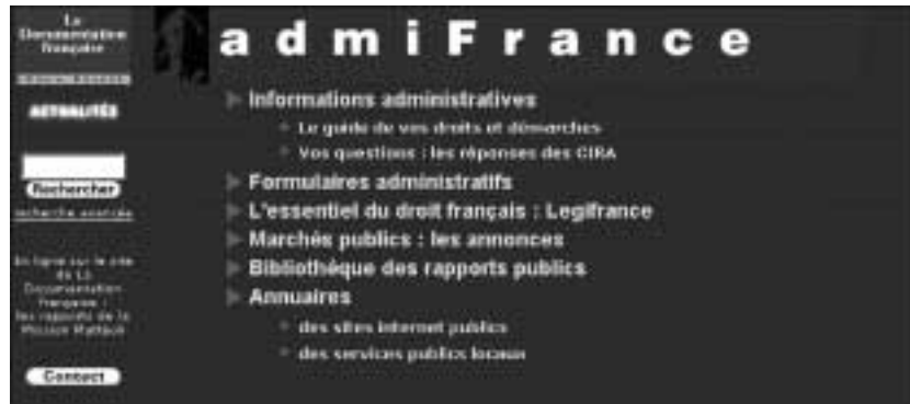
Figure 100 : La page d'accueil d'AdmiFrance.

Ce site présente sa bibliothèque des rapports publics que l'on peut télécharger. Il permet d'accéder à l'annuaire des sites internet publics.