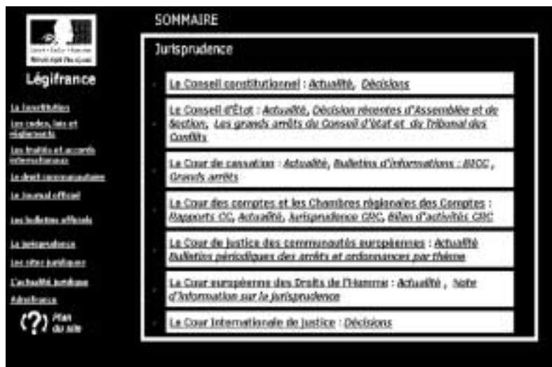
Figure 97 : La porte d'entrée vers les jurisprudences.