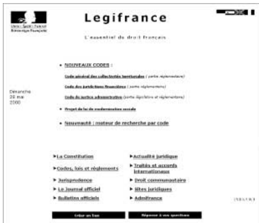
Figure 93 : La page d'accueil de Legifrance.

La page d'accueil permet l'accès à différentes données : la constitution, les codes, le journal officiel, les bulletins officiels des ministères, les jurisprudences, etc.