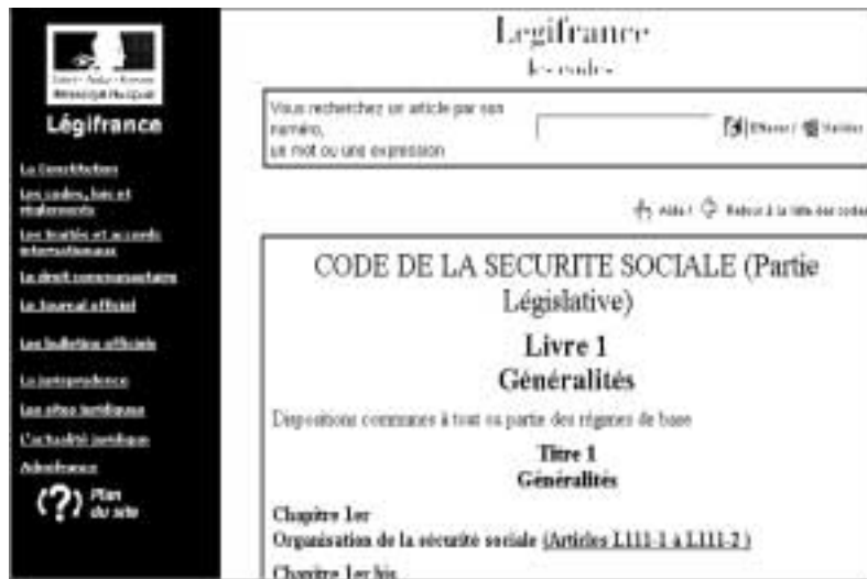
Figure 95 : Les différents codes sont accessibles par un moteur de recherche.