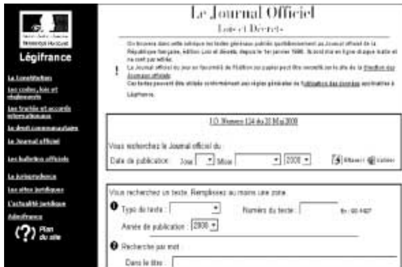
Figure 96 : L'accès aux articles du Journal officiel parus depuis le 1 er janvier 1998.