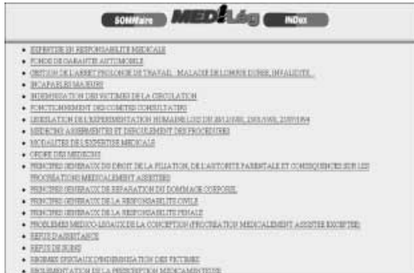
Figure 101 : La banque de données de MediLeg.

Base de données sur l'environnement juridique et réglementaire de l'acte médical.