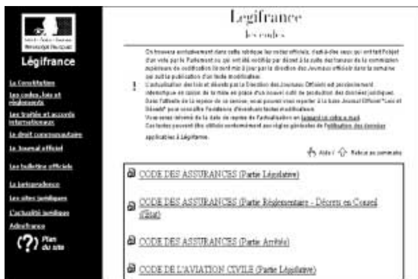
Figure 94 : La page d'accès aux différents codes.