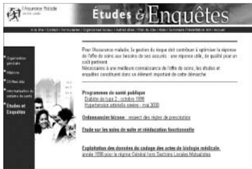
Figure 103 : Les études et enquêtes présentées par la CNAMTS.

Les études et enquêtes de l'Assurance maladie se trouvent dans le menu déroulant Assurance maladie .